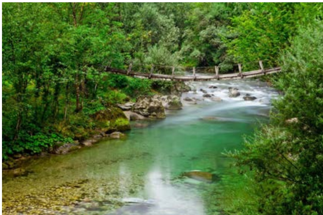
Tabela 34: Kazalniki za Ukrep 2.8 – Spodbujanje trajnostne večmodalne mobilnosti