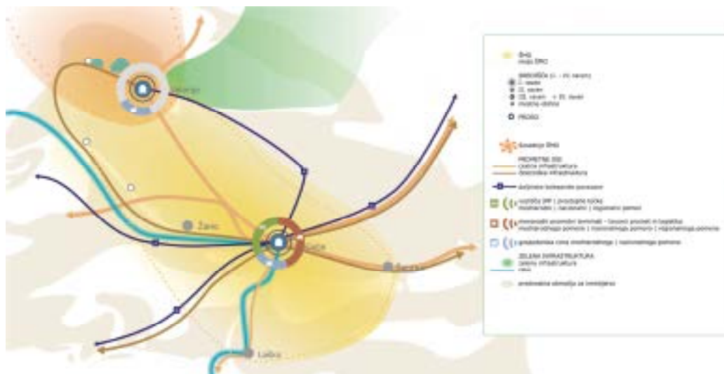
Slika 2: Savinjsko širše mestno območje, (Vir: MOP, Savinjska regija, Usmeritve za pripravo strategije razvoja regije s področja prostorskega in urbanega razvoja, 2021)

Geografska lega in zgodovinske okoliščine zaznamujejo Slovenijo kot prometno živahno prehodno območje in križišče dveh največjih vseevropskih koridorjev – V. in X., kot sta bila določena na konferenci ministrov za promet na Kreti 1994 in v Helsinkih leta 1997. Skozi Savinjsko regijo potekajo V. koridor in tovorna koridorja 5 in 6.